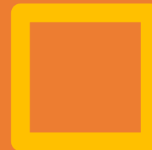
Figure 1, MacDowell, K. (2010) Solastalgia , 7"x7"x4", hand-built porcelain, cone 6 glaze. http://www.katemacdowell.com/solastalgia.html